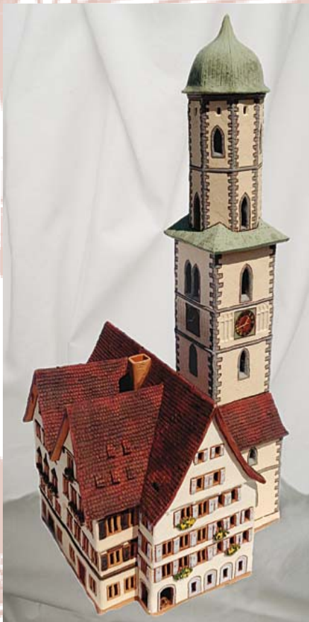
Kirchturm St. Martin

(Größe: 10,5 cm / 8,5 cm) Preis auf Anfrage!