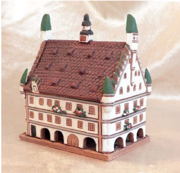
Räucherhaus Neues Rathaus