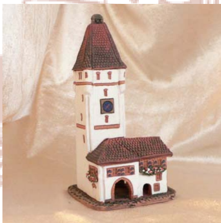
Räucherhaus Ulmer Tor