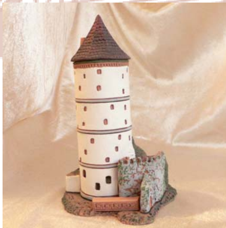
Räucherhaus Weißer Turm