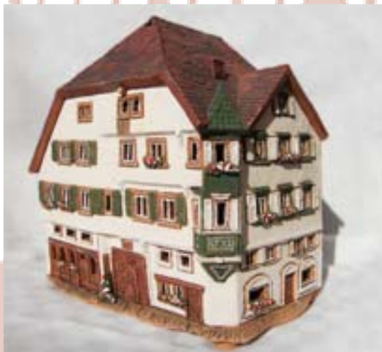
Haus Ilg – Marktplatz 2

(Größe: 21 cm / 15 cm) | Preis auf Anfrage!